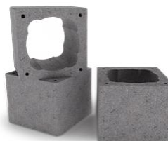
Наружные блоки из легкого бетона