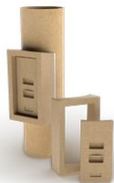
Ревизия с керамическим затвором 1 шт, Н 660 мм