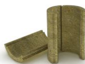
Негорючая изоляция дымохода AWT