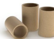
Керамические трубы в необходимом количестве, 3 шт на 1 метр