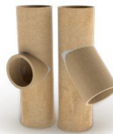
Элемент для подключения к дымоходу 90 или 45 гр 1 шт, Н 660 мм