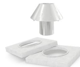
НЕ ВХОДИТ В СТОИМОСТЬ Верхний комплект